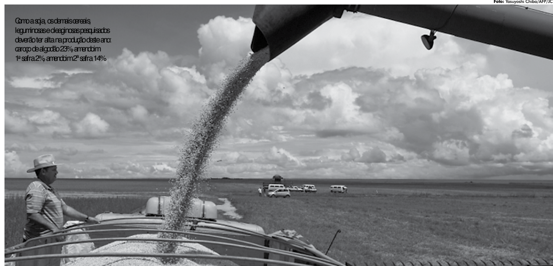
Como a soja, os demais cereais, leguminosas e oleaginosas pesquisados deverão ter alta na produção deste ano: carço de algodão 23%, amendoim 1ª safra 2%, amendoim 2ª safra 14%.