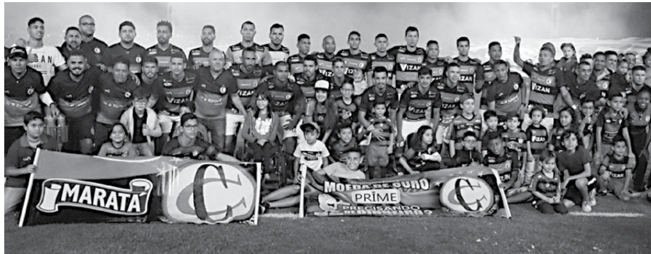
O Campinense chegou muito perto de conseguir uma vaga para a Série C, o que aumentaria para 5 os clubes paraibanos no Brasileiro de 2019, mas se matou na Série D do lado do Serrano.

O ambiente no Campinense é de total tristeza, após a eliminação. Os jogadores consideraram injusta a eliminação, por tudo que o clube fez na competição e principalmente na partida da última segunda-feira, quando pressionou o adversário até os minutos finais. "Deus não quis. A bola não queria entrar. O adver-