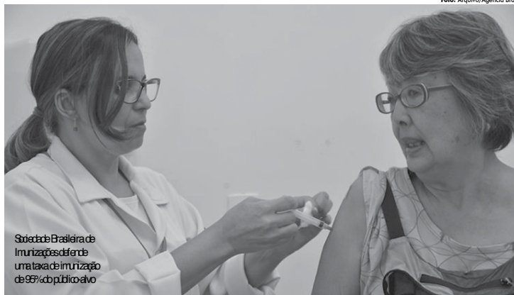
Sociedade Brasileira de Imunizações defende uma taxa de imunização de 95% do público-alvo

O grupo de doenças pode voltar a circular no Brasil caso a cobertura vacinal, sobretudo entre crianças, não aumente. O alerta é da Sociedade Brasileira