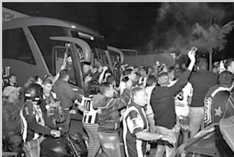
Torçãdo Treze fez uma grande festa para receber os jogadores em CG.